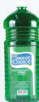
DESINFECTANTE SWEET CHOICE 64 OZ.