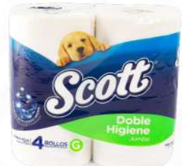
SCOTT PAPEL HIG. DOB 2P REGULAR 245 FT 4 ROLLOS $145.00