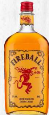
FIREBALL WHISKY CINNAMON 750 ML. $1,300.00