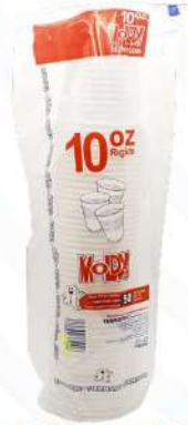
TERMOPAC VASOS MOLDY 10 OZ. 50 UDS.