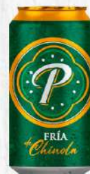
PRESIDENTE GUAYABA LATA UD. $50.00