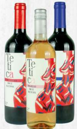
VINO TETICA 750 ML. (TODA LA VARIEDAD) $625.00