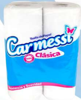
CARMESSI PAPEL TOALLA 2 ROLLOS