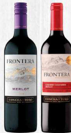
VINOS FRONTERA 750 ML. $495.00