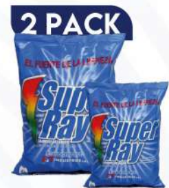
2 PACK SÚPER RAY OFERTA DETEGENTE 400 GRs. +200 GRs. $135.00