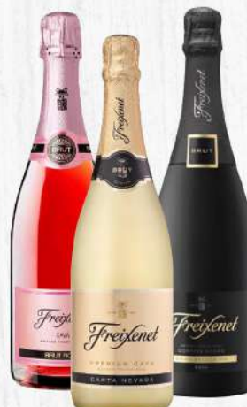
FREIXENET 75 CL. $870.00