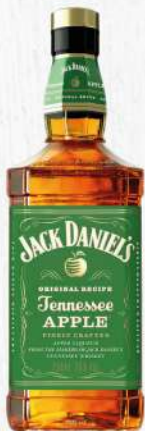
WHISKY JACK DANIEL'S APPLE 750 ML. $1,640.00