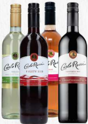
VINO CARLO ROSSI (RED, FRUITY RED, WHITE Y ROSE) 750 ML. $350.00