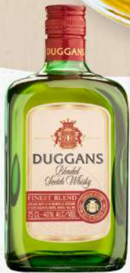
WHISKY DUGGANS SCOTCH BLENDED 12 AÑOS 750 ML. $825.00