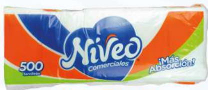
NIVEO SERVILLETA COMERCIAL 500 UDS. $135.00