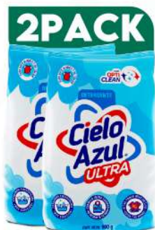
DETERGENTE CIELO AZUL 900 GRs. $160.00