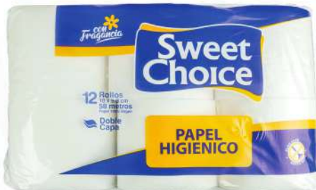
PAPEL HIGIÉNICO SWEET CHOICE 12/1