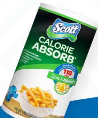
PAPEL TOALLA ABORB CALORIE $160.00