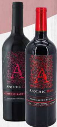
VINO APOTHIC RED // CABERNET SAUVIGNON 750 ML. $1,290.00