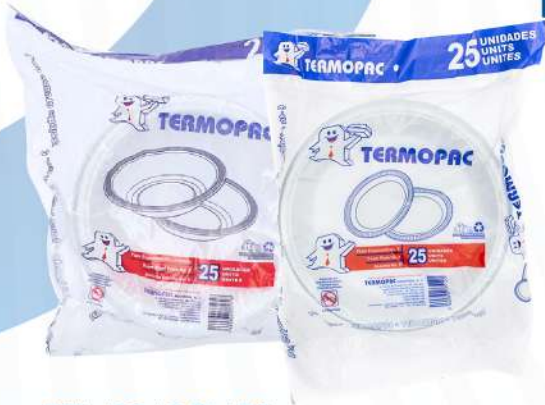
TERMOPAC PLATO HONDO NO.9 25 UDS.