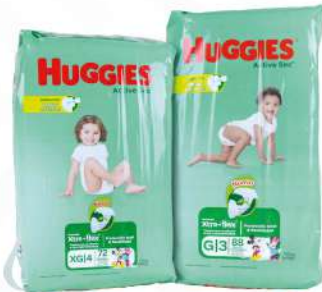
HUGGIES ACTIVE SEC GIGA PACK TODOS LOS PASOS $1,370.00