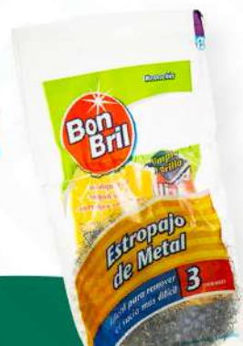
BON BRIL ESTROPAJO METAL 3 UND $40.00