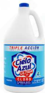
CLORO CIELO AZUL GLN. $95.00