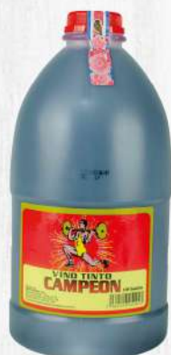
VINO CAMPEÓN 1/2 GLN. $300.00