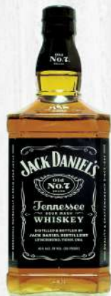
WHISKY JACK DANIEL'S #7 750 ML. $1,770.00