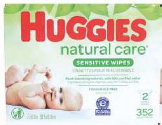
HUGGIES BABY WIPES 352/1 $935.00