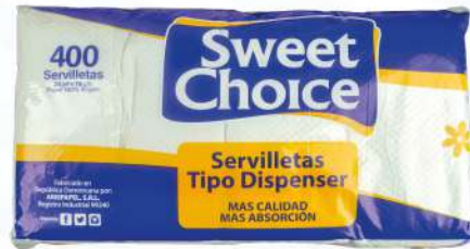
SERVILLETAS SWEET CHOICE 400/1