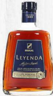
RON BRUGAL LEYENDA 700 ML. $1,145.00