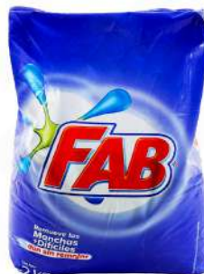
DETERGENTE FAB 800GRs. (TODA LA VARIEDAD) $190.00