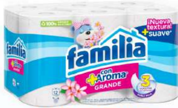
FAMILIA PAPEL HIG. AROMA GRANDE ROLLO 12/1 $275.00