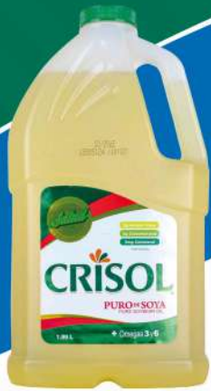
ACEITE CRISOL 64 OZ. $305.00