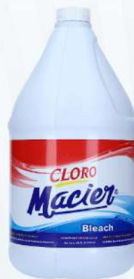
CLORO MACIER 1 GLN. $81.00