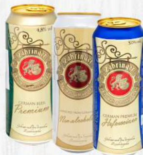
CERVEZA ZARINGER 500 ML. TODA LA VARIEDAD $90.00