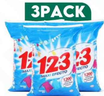
1-2-3 DETERGENTE MAXI PODER 350 GRs. $130.00