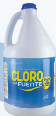
CLORO LA FUENTE 1 GLN.