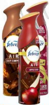
FEBREZE AIR 8.8 OZ. APPLE//CRANBERRY//COZY $265.00