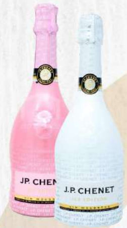
JP CHENET ICE EDITION (AMBAS VARIEDADES) 750 ML. $555.00