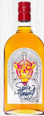
WHISKY SPICE MONKEY 75 CL. $960.00