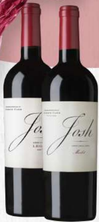
VINOS JOSH 75 CL. $1,165.00