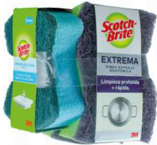
ESPONJA DUO EXTREMA + MINI DE BAÑO $85.00