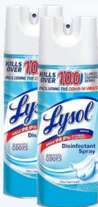
LYSOL DESINFECTANTE AERO. 12 OZ. (TODA LA VARIEDAD) $435.00