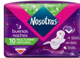
TOALLAS KOTEX NOCTURNA PAGUE 8 LLEVE 10 $100.00