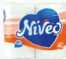
NIVEO PAPEL HIGIÉNICO L 4 ROLLOS $81.00