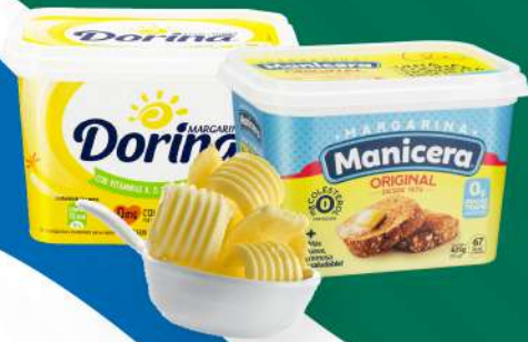
MARGARINA MANICERA 1 LB. $85.00 MARGARINA DORINA 1 LB. $125.00