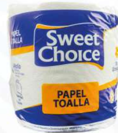
PAPEL TOALLA SWEET CHOICE 1 ROLLO