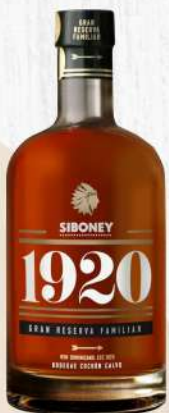
RON SIBONEY 1920 GRAN RESERVA FAM. 700 ML. $1,100.00