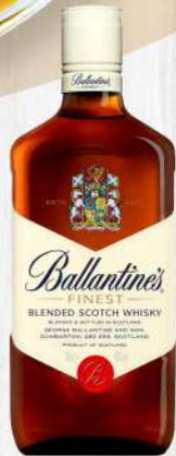
WHISKY BALLANTINES FINEST BLE. SCO. 750 ML. $945.00