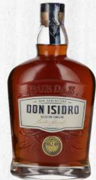
RON DON ISIDRO SELECCION FAMILIA 700 ML. $1,140.00