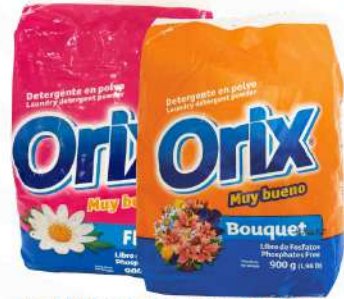
DETERGENTE EN POLVO ORIX 900 GRs. (PRIMAVERAL/BOUQUET) $115.00