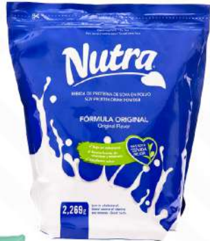
NUTRA LECHE FUNDA 2269 GRs. $1,200.00