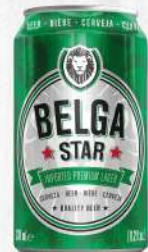
CERVEZA BELGA STAR LATA 330 ML. $80.00