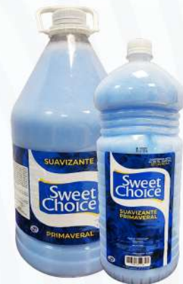
SUAVIZANTE SWEET CHOICE