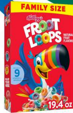
CEREAL FROOT LOOPS $355.00