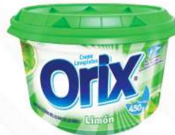
ORIX CREMA LAVAPLATOS LIMON 450 GRs. $55.00