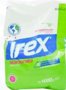
IREX DETERGENTE BICARBONATO 1000 GRs. $145.00