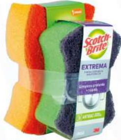
ESPONJA DE COCINA + MINI DE BAÑO $180.00