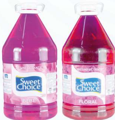
DESINFECTANTE SWEET CHOICE 64 OZ.