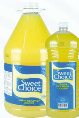
JABÓN DE CUABA SWEET CHOICE